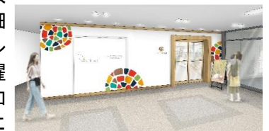
「ココトモカフェ」のイメージ