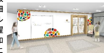
「ココトモカフェ」のイメージ