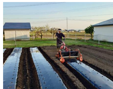
近くの認定こども園の畑での作業 ●