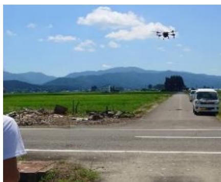
ドローンで農業散布 ●

2025 年 3月に農業法人の代表理事に就任しました。経営に携わるようになり、組織の決定権が分散し、物事がスムーズに進んでいないと感じ、1年後の 2026 年 3月に株式会社へ組織変更し、スピード感を持った運営にシフトしました。