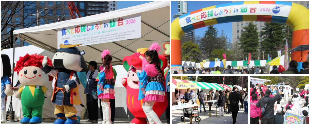
▲「食べて応援しよう！in仙台2026」会場の様子

東北農政局は、東日本大震災により被災した地域の農林水産物等を積極的に消費する「食べて応援しよう！」の取組の一環として、岩手・宮城・福島3県の農林漁業者、食品事業者が農林水産物や加工食品などを販売するイベント「食べて応援しよう！in仙台2026」を3月14日～15日に開催しました。ご来場いただいた皆様、ありがとうございました。