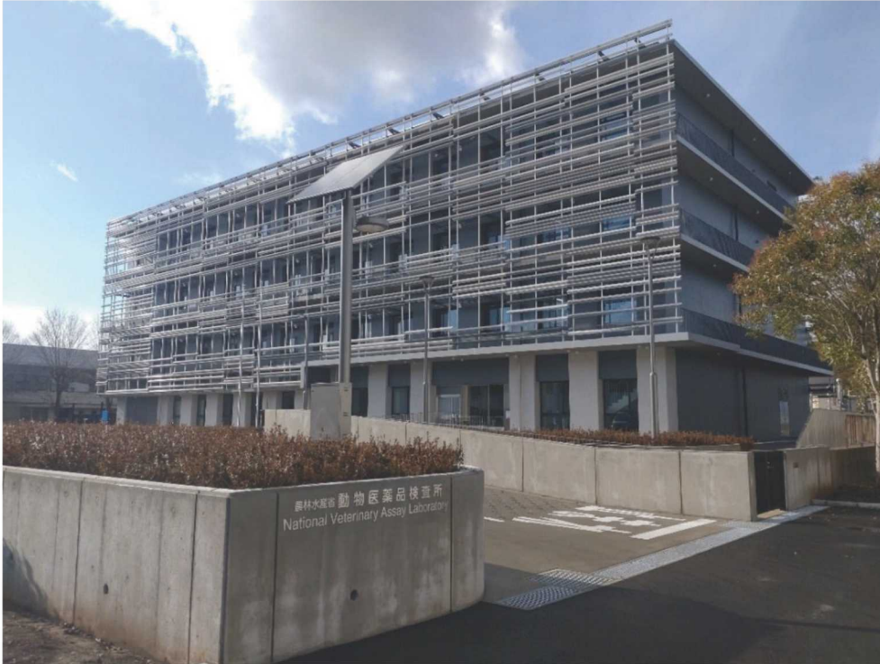
つくば本庁舎 (令和7年3月現在)

対外対応としては、移転時期の国家検定業務への影響について、動物用生物学的製剤の製造販売業者及び都道府県薬事監視業務担当職員を対象に、それぞれ令和6年10月に説明を行い、令和7年度の当所新庁舎移転期間中の業務への影響の理解と協力を求めた。