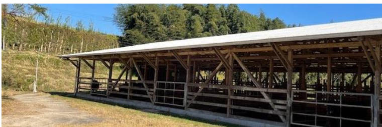
国の事業を利用し 建設した牛舎