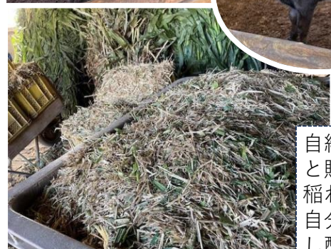
自給粗飼料 と購入した 稲わら等を 自分で裁断 し配合する