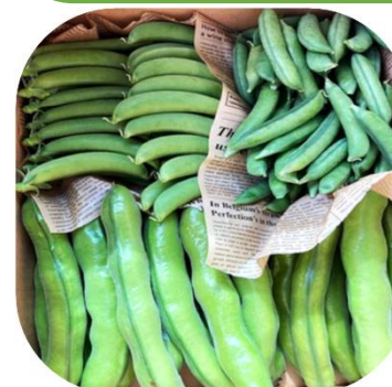
スナップエンドウ (左上) まめこぞう (グリーンピース) (右上) そらまめ (下)

HP : https://www.matsuki-agri.com Mail : agri.ctky8@gmail.com 公式LINE ID : @735yctqo