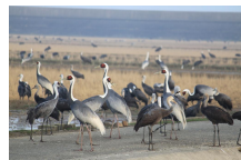
②：出水市ツル観察センター