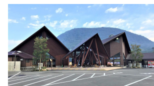
⑤：道の駅「樋脇」遊湯館