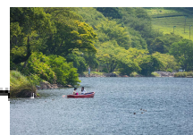
③：蘭牟田池自然公園

住所：薩摩川内市東郷町南瀬606 メモ：カフェ・メニュー 緑茶、抹茶、抹茶ラテ、紅茶、桑葉、桑葉ラテ、自家製抹茶の葛餅、焼き菓子など 定休日：日曜日・祝日