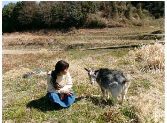
飼っているヤギが畑の雑草を食べてくれます

訪れた人が「こんな暮らしもいいな」と感じ られる、やさしい時間が流れる場所です。