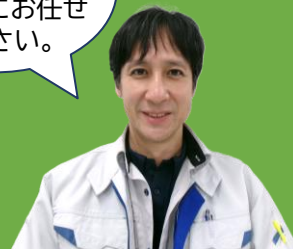
地方参事官室職員