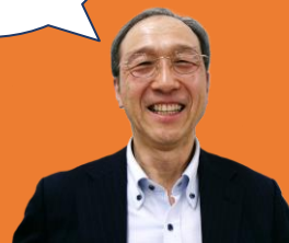
生産・経営所得担当職員