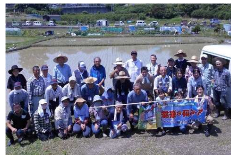
たんぼの楽耕のみなさん

河合町では、これまでにたんぼの楽耕の活動により、約62アールの荒廃農地を解消し、また、参加者2人が新規就農することで農地約43アールの貸付けを行いました。