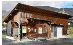
卵かけご飯専門店 但熊（たんくま）