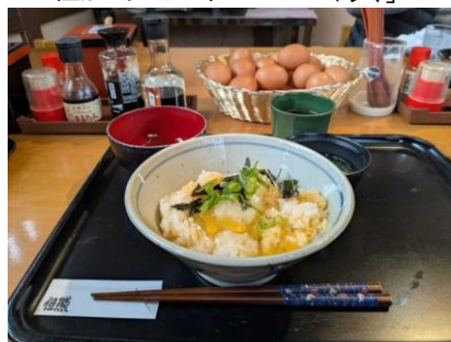
但熊の看板メニュー 卵かけご飯定食

卵かけご飯専門店「但熊」は、兵庫県豊岡市にあり、株式会社西垣養鶏場によって運営されています。2006年（平成18年）に開店し、現在では年間約4万人が訪れる人気店となっています。