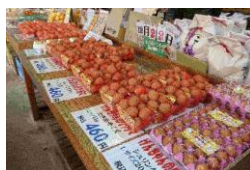
百笑館（卵・米コーナー） 但熊式番館（スイーツ店）

また、敷地内に併設する「但熊式番館」では、自社の卵を使用したプリン、ロールケーキ、ドーナツ等のスイーツを、直売所「百笑館」では、