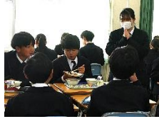
【中学生と高校生が交流】

令和7年12月8日（月曜日）、加東市立の小中学校、義務教育学校において、兵庫県立高等学校生活科学3年生が考案した有機農産物等を使用した給食が提供されました。また、加東市立滝野中学校では、メニューを考案した高校生が教室を訪れ、中学生と交流を行いました。