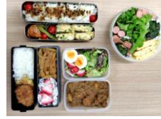
【有機農産物を使った手作りお弁当】

令和7年12月15日（月曜日）、兵庫県拠点の職員がスーパー等で購入した有機農産物でお弁当を作り、持参しました。