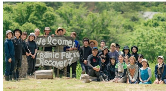
【(株)ディスカバリープロジェクトの皆さん】

休耕田25aからスタートし、現在では町内5地域、約4haで有機にんにくを栽培しています。