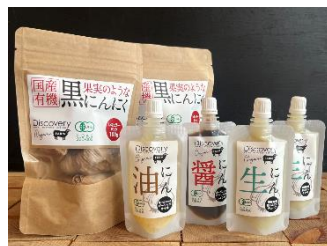
【有機にんにくの加工品】