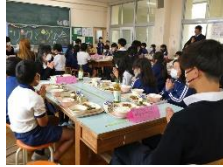
【小学生と高校生が交流】

令和7年12月12日（金曜日）、加西市内の全小中学校、特別支援学校において、有機農業で栽培されたお米等を使用した給食が提供されました。また、九会小学校では、児童に田植えや稲刈りを指導した播磨農業高等学校の生徒や、圃場を提供した三宅酒造(株)等を招待した給食試食会が行われました。