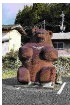
但熊のシンボル 「クマ」