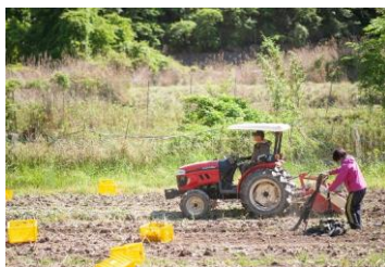
【有機にんにくの収穫風景】