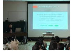
【小学校での食育授業】