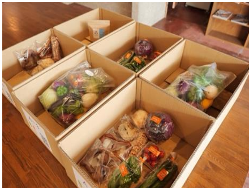
ステーションに設置された商品提供専用箱