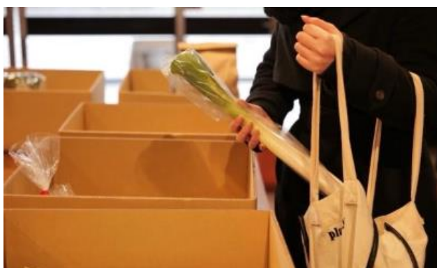
ステーションで購入者が商品を受け取る様子