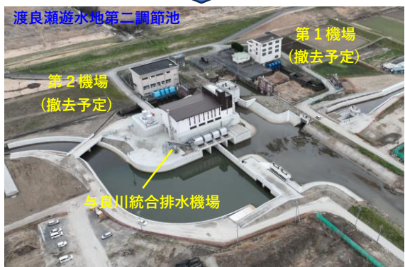
令和6年3月 与良川統合排水機場完成