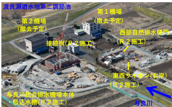
令和3年3月 （吸込水槽、西部自然排水樋門、東西サイホン（右岸）施工）