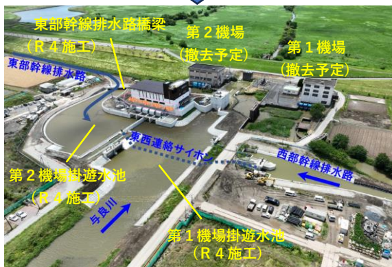
令和5年5月 総合試運転調整