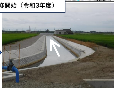
令和4年3月 （西清水川排水路その3工事 完成）