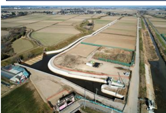
令和6年1月 西部幹線排水路改修工事（その1）（その2）完成