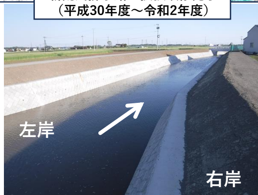
令和3年3月（新荒川排水路完成）