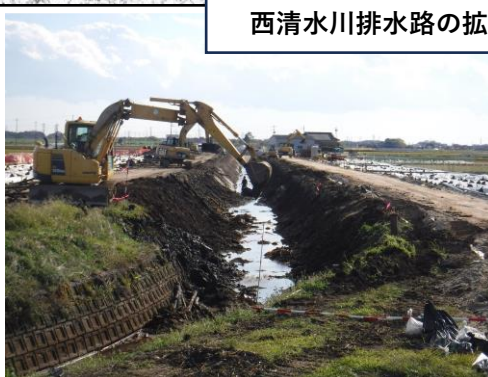
令和3年11月 積ブロック取壊し工 （西清水川排水路その3工事）