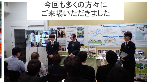
今回も多くの方々に ご来場いただきました