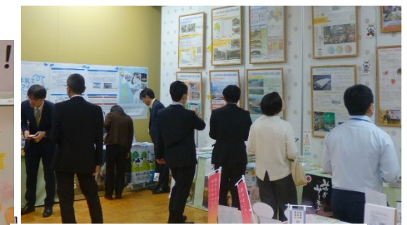
東北3県の特産品等の物販もありました