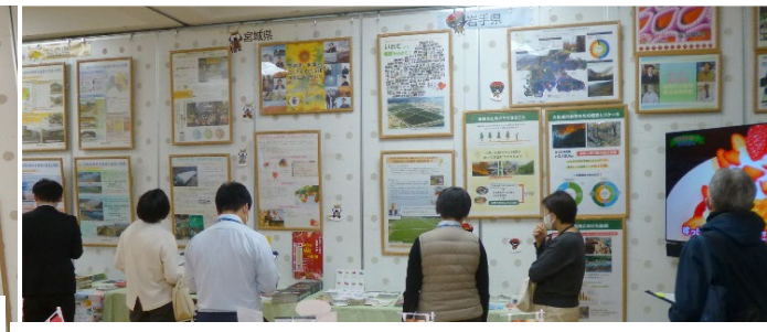
ご来場者の皆様から たくさんの応援メッセージをいただきました