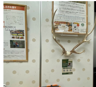
エゾシカの角、ジビエ関連製品やパネルを展示