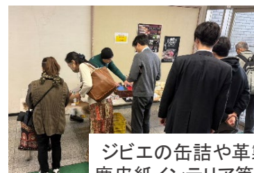
ジビエの缶詰や革製品、 鹿皮紙インテリア等を販売