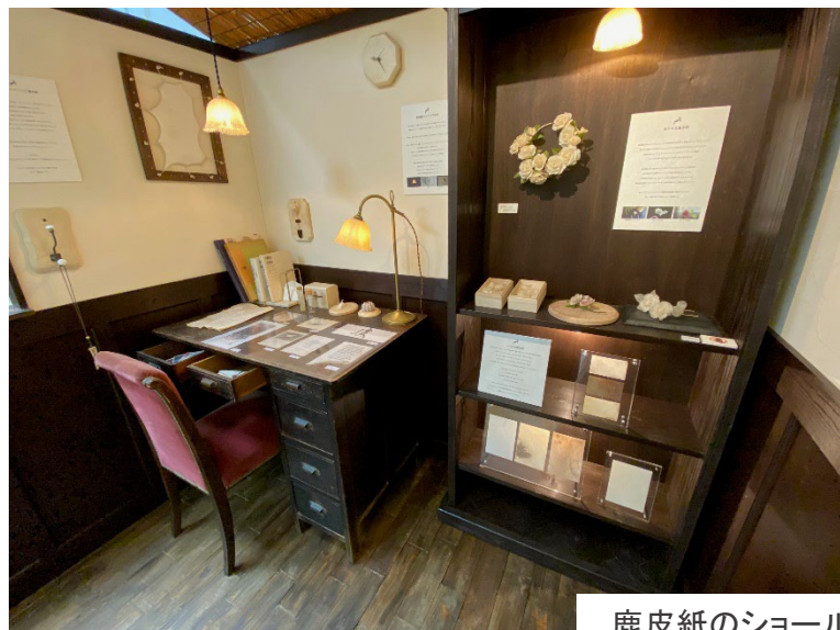
鹿皮紙のショールームをイメージした展示

また、シカ皮を使った楽器(三味線、太鼓)の体験コーナーの設置や、シカ皮の羊皮紙「鹿皮紙(しかひし)」を使ったワークショップも開催しました。