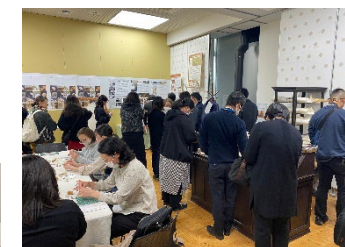
学校訪問の生徒さんはじめ、多くの方々に ご来場いただきました