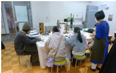
シカ皮の三味線コーナー(左・中央)と鹿皮紙を使った小物作りワークショップ(右)