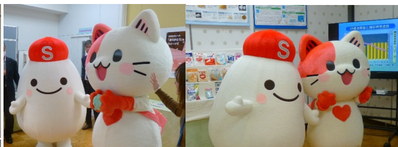
「ありが糖運動」公式マスコットキャラクター「かんみい」(右)と、業界団体の協力による、お砂糖の妖精「シュガタン」(左)