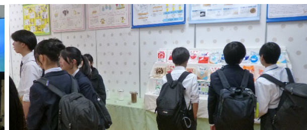
学校訪問の生徒さんはじめ、多くの方々にご来場いただきました