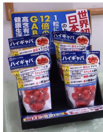
品種改良加速技術(ゲノム編集技 術)で作られたギャバ高蓄積トマト