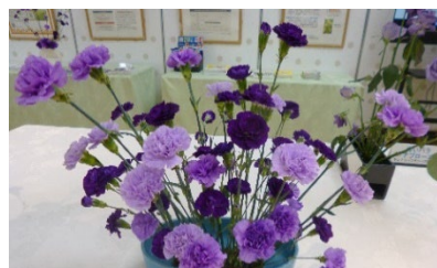
遺伝子組換え技術で開発された 青いカーネーションや 青いコチョウラン