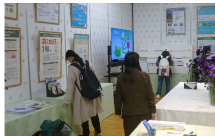
新品種の開発に関する 数々のパネル展示等