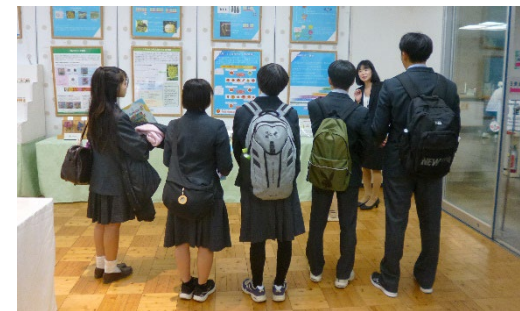
学校訪問の生徒さんたちははじめ、 多くの方々にご来場いただきました