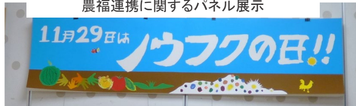
「ノウフクアワード2024」受賞団体の紹介など 農福連携に関するパネル展示

概要:「農福連携」は、障害を持つ方などが農業分野で活躍することを通じて、自信や生きがいを持って社会参画を実現していく取組です。本展示では、11月29日の「ノウフクの日」にちなみ、「ノウフク・アワード2024」受賞団体、農福連携の現場で活躍する障害者の方々の声を集めた「みんなの声」などのパネル展示、企業による農福連携の取組紹介、農福連携の取り組みによって生産された商品の展示、農福連携に関する動画の放映など、農福連携の取り組みを多数ご紹介しました。