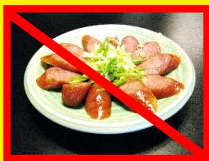
シャンチャン(香腸)