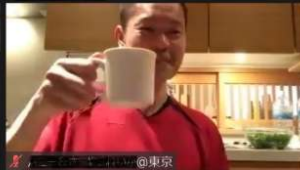
タッキー先生@東京