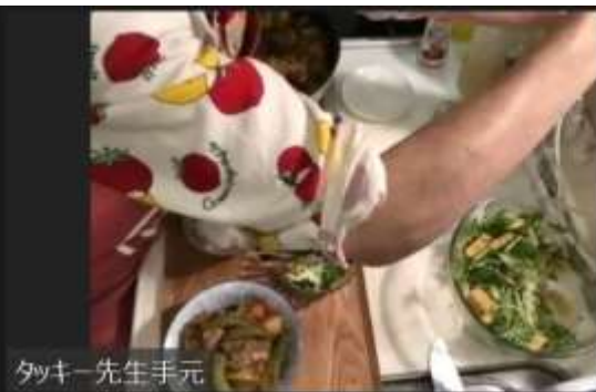
タッキー先生手元