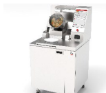
炒め調理ロボット