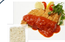
こんにやくとおからから作られたカツ