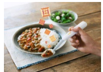
塩味を増強するスプーン

事業戦略検討、試作品製造、マーケティングリサーチ、商品デザイン、テストマーケティング、販路確保、原材料確保実装に必要な生産ラインの整備、認可取得等