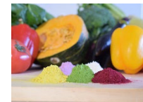
アップサイクル食品