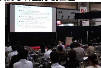
人権尊重に関するセミナーの様子（「食サス」の一環として実施） 26