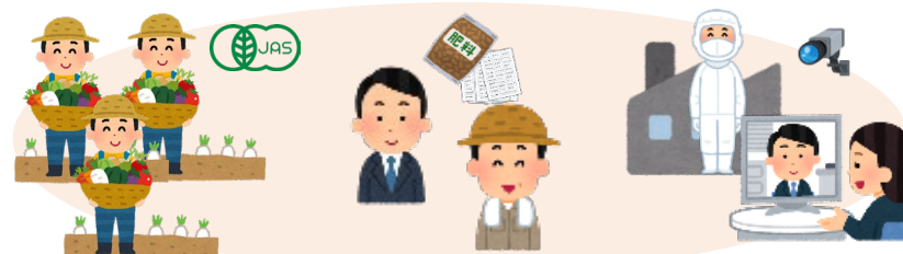
有機JAS認証取得の促進、事業者の負担軽減