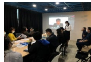
研修会による知見の共有