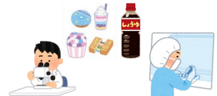
商品の開発に必要な分析機器導入等