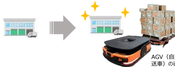
AGV（自動搬送車）の導入