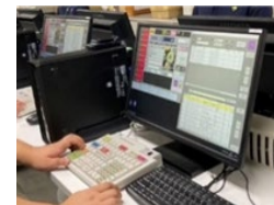
インターネット取引システムの導入