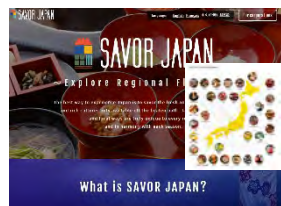
各認定地域の紹介