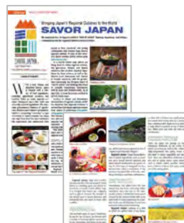
内閣府政府広報室海外広報 (Highlighting Japan 2022年6月号)