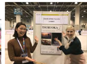
商談会への出展 (VISIT JAPAN Travel & Mice Mart 2019)