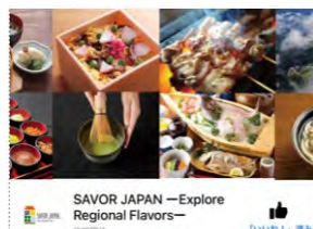
Facebookによる情報発信（F Bフォロワー18万人）