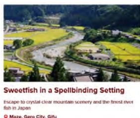
政府観光局（J N T O）