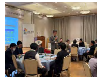
認定地域間の情報交換