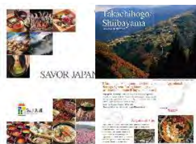
広報資材の作成（ポスター、パンフレット）