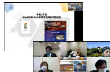
新認定地域向け勉強会（オンライン）

新認定地域向け勉強会・意見交換会、基礎知識・技術習得のための講座・研修会、情報交換会等の開催