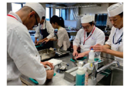
外国人日本食料理人を日本に招へいした日本料理店での研修等の実施を支援

調理技能等が一定のレベルに達した外国人日本食料理人を民間団体等が認定する制度の運用を支援