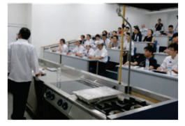
海外の料理学校等での日本食講座開設や講師派遣を支援