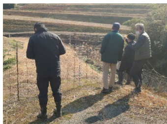
電圧異常の通知により現地確認及び電気柵の原状回復