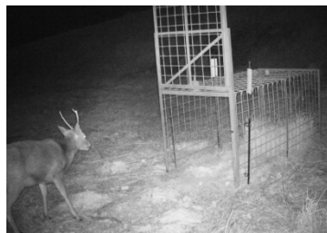
撮影データを分析し、効率的な捕獲を実証