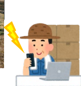
電気柵監視システムにより遠隔地で監視や確認