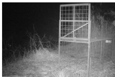
センサーカメラを設置し、わな周辺を撮影