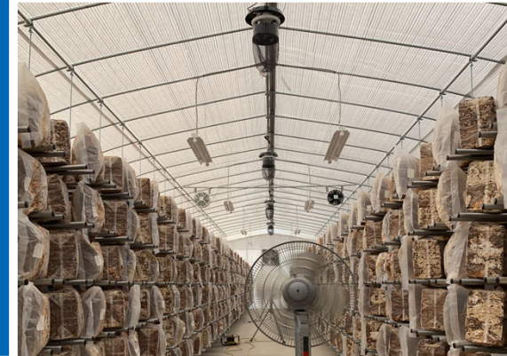
品目：シイタケ 菌床栽培