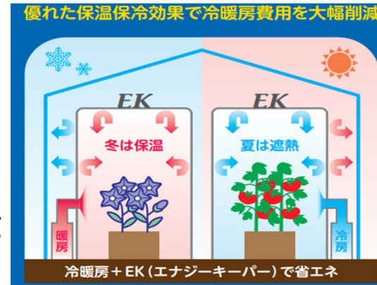
断熱効果イメージ