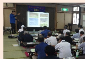
エ 専門家等による助言