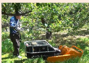
ア 農業用機械の導入