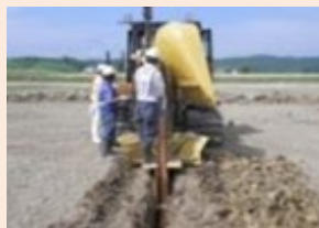
イ 生産環境条件整備