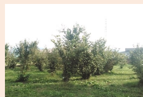
㊨ 省力化作物の導入