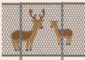
ウ 鳥獣被害防止対策