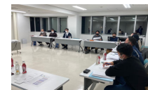
合意形成・計画づくり

住民意向調査、地域住民によるワークショップ開催 資源活用の推進体制・組織の整備、実施計画づくり 等