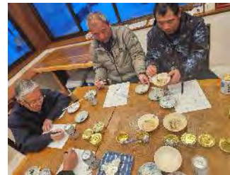
【協議会メンバーでの試作品試食の様子】