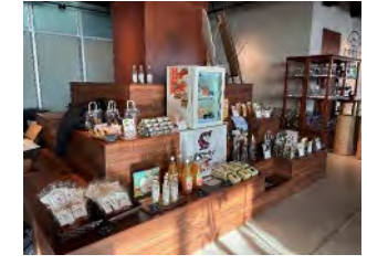
【レストラン・イベントでの商品展示】