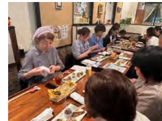
【レストランイベントでの食材PR】