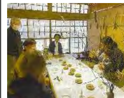
【イベント「香りの 中の森」の様子】