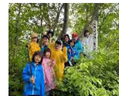
【開発したツアー体験 プログラムの様子】