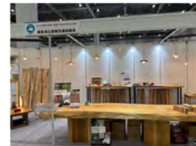
【WOODコレクション（モクコレ）出展】