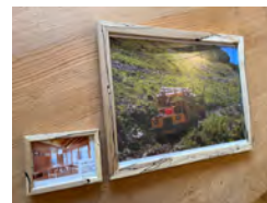
【スポルテッド製品（フォトフレーム）】