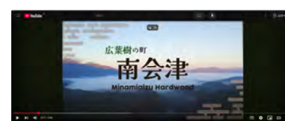
【WOODコレクション（モクコレ）出展におけるプロモーション動画】