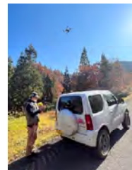
【ドローンによる資源量調査】