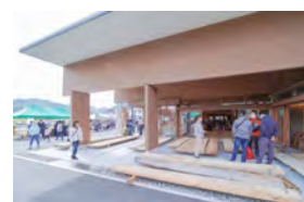
【町内で開催したビジネスマッチング】