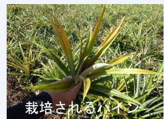
栽培されるパイナップル