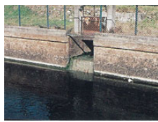
宮田導水路 （雑排水流入）