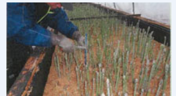
アスパラガスの収穫

水稻を中心に、大豆、小麦、キャベツの作付けのほか、アスパラガス、すいかなど多品目を導入し、年間を通じた作業体制を確保している。冬季は育苗ハウスでアスパラガスを、夏季はすいかを栽培し、収益の減少を補っている。季節に左右されない雇用体制を構築し、従業員の安定雇用と地域農業の持続性を実現している。