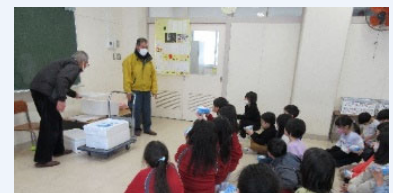
地元小学校との豆腐づくり

地域住民と交流を深めるため、地元小学校を対象に地域農業をテーマに食育活動に協力している。児童と一緒に、学校の花壇への大豆播種、大豆収穫体験、豆腐づくりやドローン飛行の見学会などを通じて、収穫の喜び、食の大切さや農業の魅力を伝えるとともに、農業技術の普及と持続可能な地域づくりに寄与している。