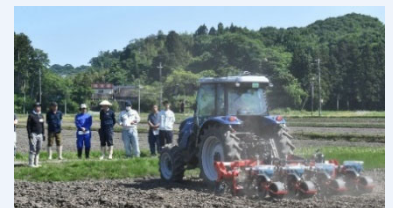
高速畝立て播種機による種蒔き

県内に2台しかない4条の高速畝立て播種機を導入し、通常の数倍以上の速度で播種が可能のため、作業時間を大幅に短縮。約50haの大豆ほ場で効率的に播種するため、3条播種機2台と併用し、梅雨時期の限られた時間内で、1日に約10haの播種が可能となり、生育の均一化、品質の向上や収量の安定化を実現している。