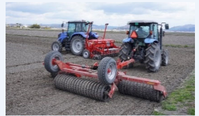
乾田直播での播種作業

土地改良事業による農業用水の安定供給と大区画化により経営規模を拡大、水稻の作付面積の半分以上で乾田直播を導入し、省力化と低コスト化を実現。FOEASとスマート農業を組み合わせ、安定収量や品質を確保するため、十余年の試行錯誤を経て栽培技術確立し、移植栽培と同等の収量を確保。県内外から視察を受け入れ、技術紹介や現地案内などにより地域貢献している。