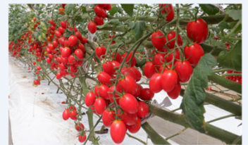
ミニトマトの施設栽培

震災後の営農再開にあたり、復興交付金によるほ場整備により大区画化や農地の集積を進め、本事業により基幹的農業水利施設を改修し、湛水被害が軽減したことにより効率的な作業が可能となった。地域の担い手として、農地バンク等を通じた農地の集約、乾田直播、スマート農業による省力化を図り、水田畑利用、施設栽培（ミニトマト）により、経営規模を拡大している。