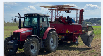
ばれいしょの収穫作業

米の需要減少傾向への対策として、3年前に高収益作物の導入を検討し、県からの推奨と機械化が可能なばれいしょを作付け、カルビーポテト(株)と契約栽培。生産実績は、牛糞堆肥の投入による土づくりや二重明渠等の排水対策との相乗効果により成果が実り、県内一の高単収を記録し、令和6年に県知事賞を受けている。