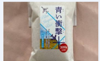
オリジナル米(青い衝撃米)

震災後、被災農地を活用し、二条大麦の作付けを開始し、ビール等の原料として出荷。復興支援の一環として地元法人（HOPE）などが製造・販売するクラフトビール等に協力している。また、地域の発展と自社の認知向上を目的に、ササニシキを使用したオリジナル米「青い衝撃米」を直売所を中心に生産・販売している。