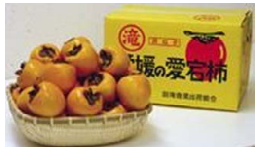
写真3 愛宕柿と㊦マーク

平成20年に出荷組合は、㊦マークを商標登録して類似品との差別化を図り、市場における知名度やブランド価値を向上させた。出荷箱やパンフレット等の情報媒体にはマークを付けてPRを行い、新しい流通経路の開拓にも努めたことにより、現在では九州と四国内に固定した販路を確保している。生産者自身の厳しい目で選別や出荷作業を行い、常に品