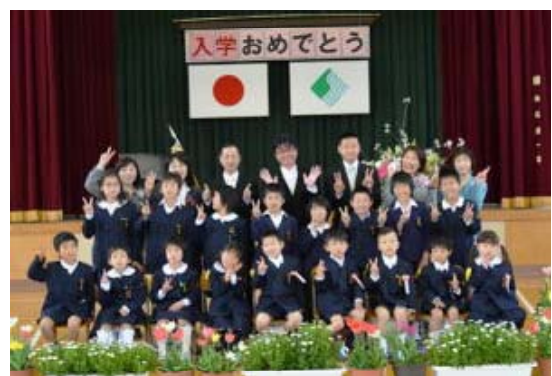
写真5 平成24年の入学式