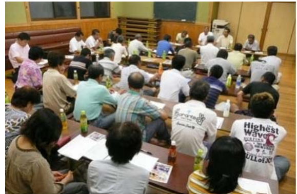
写真2 集落独自のシンポジウム

集落内の田滝小学校では、平成15と16年の新生がおらず、平成15年に田滝小学校の児童数が24人から17人に減少した。これが住民の間に危機感を生み、自治会の呼びかけで、平成16年6月に田滝の活性化や未来像について住民自らが考える「明日の田滝を考えるシンポジウム」が始まった。