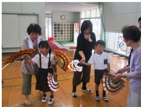
写真6 お簾踊りの練習

子どもたちに踊りを伝えていこうと昭和52年から小学校での夜間稽古が始まり、毎年8月15日に小学校校庭で盆踊りと合わせて披露されている。 ほかにも、子どもたちと集落の人は、秋祭りで披露する獅子舞と一緒に練習するとともに、12月に老人会が中心となったしめ縄づくりを小学校で行い、子どもたちが作ったしめ縄を新年を迎える各戸の玄関に飾っている。