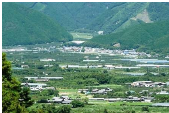
写真1 扇状地に広がる集落

田滝集落は、扇状地で石ころ混じりの砂礫層が多い地域であり、井戸を掘っても水が出ないため、谷水でわずかな田を耕していた。江戸末期から明治時代にかけて、山から畑に赤土を運んで田を開き、現在の集落と農地の基礎を作り上げた。