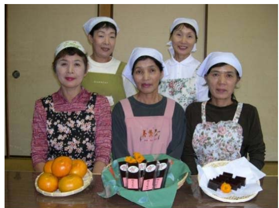
写真4 エスペランスグループ

これらの取組は、平成21年度女性チャレンジ活動表彰で農林水産省経営局長賞を受賞した。