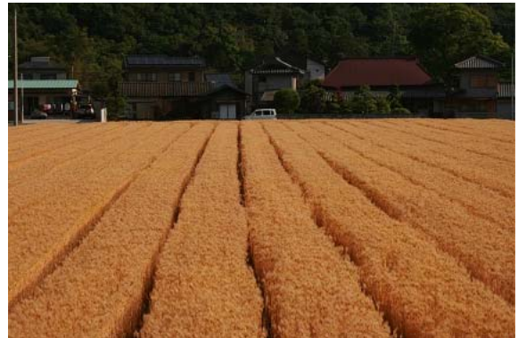
写真1 収穫前のはだか麦

園芸作物では、昭和20年代から30年代にかけてすいかの栽培が盛んであり、京阪神市場を中心に出荷されたが、病害の発生で産地は壊滅し、現在は青ねぎやアスパラガス（グリーン、ホワイト）、ブロッコリーなどが栽培されている。ほかにも、江戸後期から続く伝統の和三盆糖の原料としてさとうきびが栽培されている。