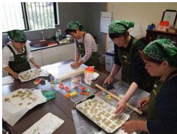
写真3 法人女性部のそばクッキーづくり

女性・生活研究グループでは、福栄で生産される大豆、そば、ブロッコリー等の農産物を活用した加工品の試作・開発を行い、味噌、そばクッキー、ブロッコリーの茎の漬物を商品化し、収穫祭やジャンボ大根コンテストなどのイベントのほか、東かがわ市生活研究グループ連絡協議会が毎週金曜日に開く「生活研究グループの店」で販売し、好評を得ている。