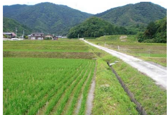
写真2 基盤整備実施後の水田

しかし、当部会の構成メンバーは設立当初から固定されており、平成16年度の時点で、65歳を超えたメンバーが6人に及び、担い手の高齢化に対する対応策が求められていた。