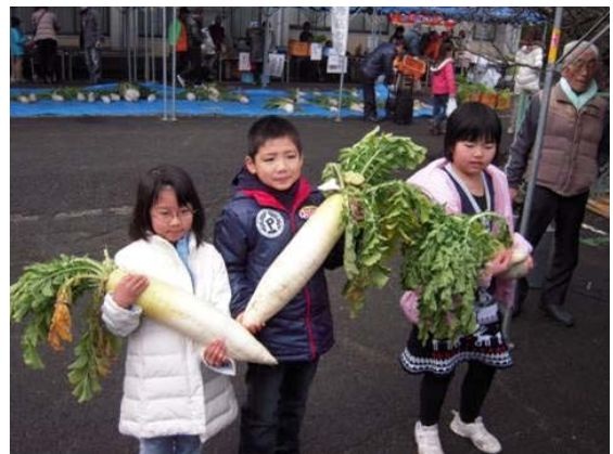
写真5 コンテスト子どもの部入賞者

協議会を中心に関係団体が協力し、地元で収穫されたブランド米「福栄米」や野菜、地元産大豆を加工した豆腐、ブロッコリーの漬物などの地域で獲れた農作物の加工品、さらに地元で捕獲されたイノシシ肉などを試食・販売をしており、地域外からもたくさんの人を集めて交流を図っている。