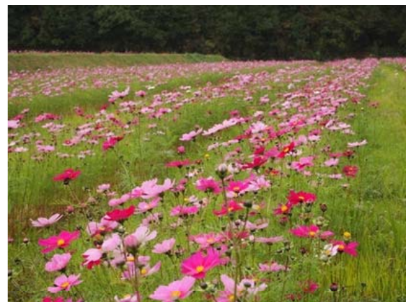
写真6 美しく咲いたコスモス

そこで福栄地区では、田んぼアート以外にも、農作物収穫後の道路沿いの農地にコスモスを栽培して「コスモス街道」を演出したり、赤そばを試験的に植えたりするなど、農村らしい美しい景観づくりにも取り組んでいる。