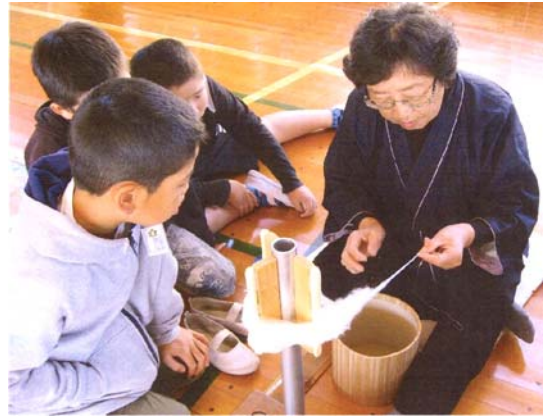
写真6 伝統の技を次世代に

平成24年度から地元小学校の「ふるさと学習」（5～6年生の総合的な学習の時間）で、結城紬の文化や歴史を教えており、講師役の組合員は「実際に機織機を学校に持ち込み、子供たちが結城紬に触れて学べる機会にしたい。」と意欲にあふれている。また、組合員が大切に保管している機織機や昔の写真等を活用し、結城紬を生産する技術や文化・伝統、絹地区の結城紬に対する熱い想いを、紬を知らない世代や地域外の人を含めた後世に伝えたいと考えている。