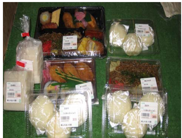
写真3 女性部自慢の品々

組合員は、今の60～70歳代の会員たちが80歳を超えても現役であれば、若者が急には増えなくても、絹地区の再生はできると考えている。