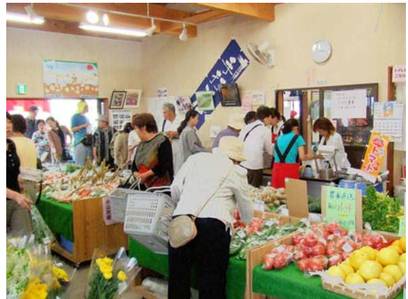
写真 4 売れる農産物

また、推進組合は、直売活動によって組合員の「売れる農産物をつくろう」という意欲を高め、所得の向上による地域経済の活性化に貢献するとともに、加工品の製造・販売活動によって地域農産物の新たな需要や地域女性の雇用の場を創出している。朝採りの少量多品目（30品目以上）の農産物や地域の農産物を原料とした加工品を組合員が自ら販売する絹ふれあいの郷は、結城紬と同様の手づくり感のある運営によって推進組合の顔となっている。