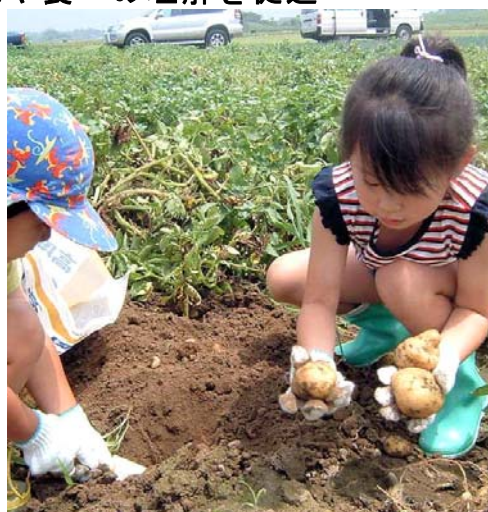
写真5 じゃがいも掘り体験

地域づくりには、農業者以外の地域住民の協力も必要と考え、地域住民の農業体験のためのじゃがいもオーナー制度（現在は「じゃがいも掘り体験」）や地元の小学校や幼稚園児のじゃがいも掘り体験、高齢者グループ・小学生のまんじゅう作り体験等を実施している。推進組合は、農作業や加工作業を通じ、地域の絆の強化、作物を作る楽しさや食に関する理解を促進している。