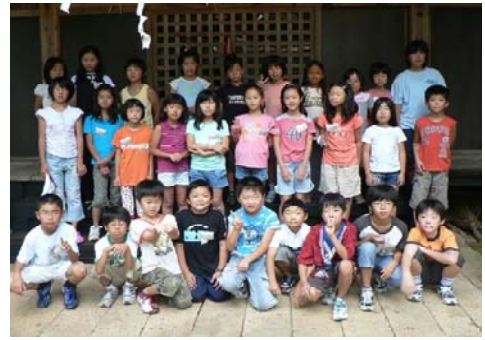
写真1 やんちゃ留学短期留学生

た児童だけが応募できることになっている。なお、留学生の募集は町田市が行い、東沢地区の協力会による面接の上で留学生を決定することになっている。これまでの21年間のやんちゃ留学では、短期留学生635名、長期留学生42名を受け入れ、都市と農村の交流を継続している。