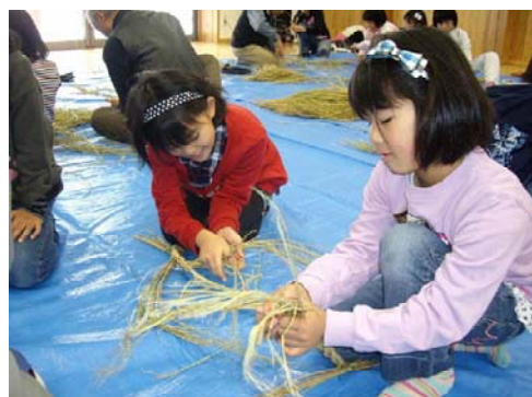
写真3 スマイルクラブ(しめ縄作り)

毎月1回、土曜日に地区内の小学生を対象とし、そば打ちや豆腐づくり、しめ縄づくりなどの食と暮らしについての体験を基にした食農教育に取り組むため、「スマイルクラブ」を開設している。このクラブでは、児童会活動のほか、夏休み期間中に短期留学生と地区内の子供が宿泊体験をしながら農産物の収穫を行うなど、食への関心を高める取組も行っている。