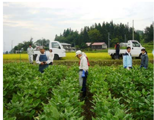
写真2 オーナー制による紅大豆栽培

また、前述の紅大豆のオーナー制のほか、平成22年度からは、宮城県仙台市の中学校の教育旅行の受入れにも取り組み、都市住民や消費者を対象とした交流事業を実施している。