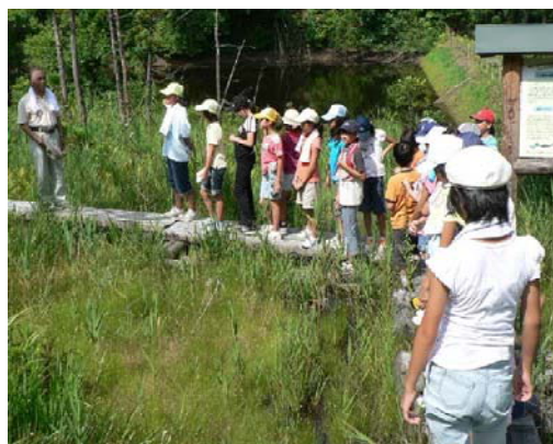
写真4 山村留学 自然学習会

湿地特有の貴重な生物(ハッチョウトンボ、モウセンゴケ等)を観察できるよう、中山間農地管理組合が補助事業によって地区内の塔ノ沢湿地に木道を整備した。毎年、児童たちの自然観察会等の学習の場となっている。