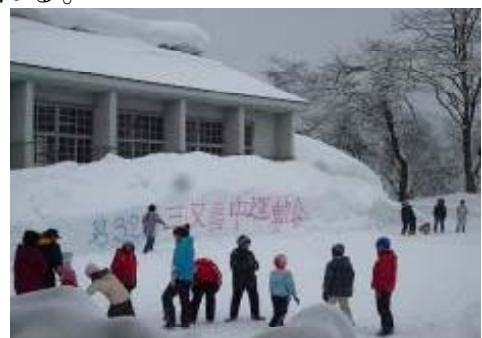
写真3 第32回三又雪中運動会

昭和55年から住民有志が始めた雪中運動会は、平成2年から会が主催しており、雪壁迷路を作るなどして大会を盛り上げ、地域になくてはならない催しとなっている。現在では、雪中運動会の開催に合わせて集