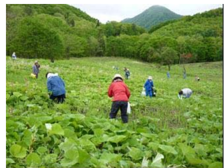
写真2 観光わらび園

平成20年、集落の耕作放棄地2haを観光わらび園に再生し、平成21年にオープンした。観光わらび園へのリピーターは多く、入場者数は平成22年約130名、平成23年180名と順調に増加しており、うち約9割が県外からの観光客となっている。