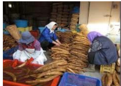
写真1 いぶりがっこづくり

いぶりがっこなどの伝統食や地場農産物、山菜、キノコなどの地域資源の価値を見直し、所得の確保と高齢者の生きがいづくりを目指し、平成20年に「三又旬菜グループ」（以下「グループ」という。）が結成された。グループは、組合の女性部を中心に6名で構成され、伝統野菜である「山内にんじん」や大根を用いて当集落が発祥のいぶりがっこ等を製造し、県内外へ販売している。