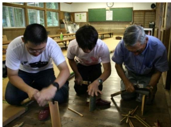
写真4 訪問者との交流