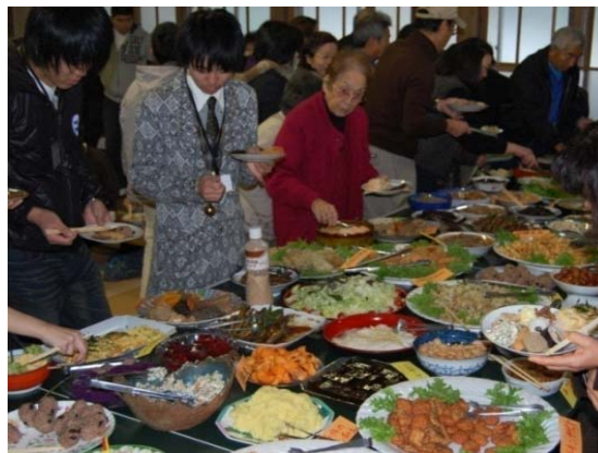
写真1 バイキングの様子

越小場地区のお米、山菜や野菜を「本井木弁当」にして、訪問者等へ安全・安心な食事を提供している。「本井木加工所」である本井木生産組合の加工部が、この越小場地区の弁当料理作りや加工販売を担っている。