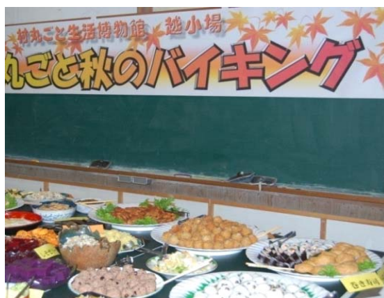
写真2 バイキング料理

定期的な地区の収入として、また県外への越小場PRとして、その果たす役割は想像以上に大きかった。