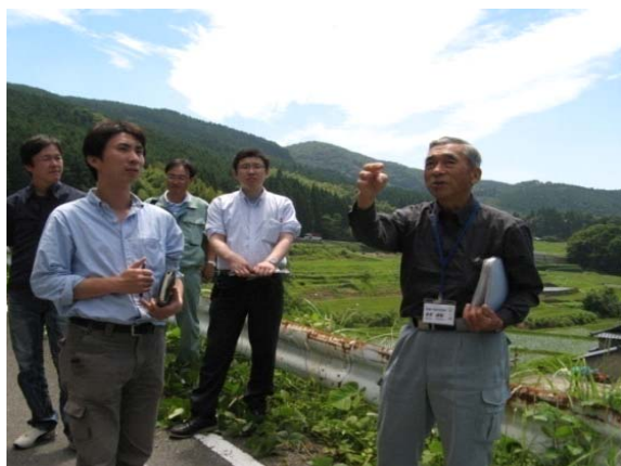
写真3 訪問者との交流

交流を通して、「越小場には何もない」という意識から、豊かな自然や村への誇りと自信を取り戻している。