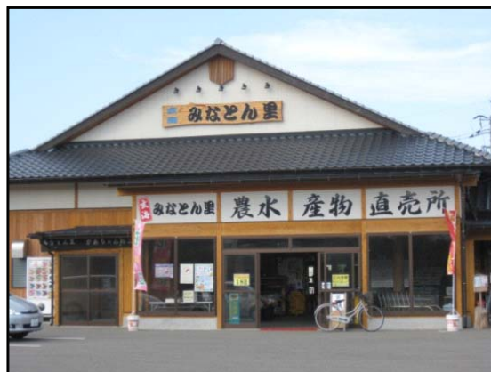
写真1 玄海みなとん里株式会社

平成10年12月、直売所に隣接した場所に饅頭や漬物、味噌などの加工・販売ができる施設を整備し、名称を女性農業者にちなんで「かあちゃん加工部」と名付け、本格的に加工活動を開始した。