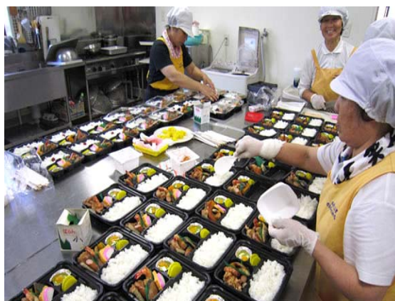
写真2 かあちゃん加工部の取組

開発した商品として「熟成かあちゃん味噌」「かあちゃん饅頭(小豆あん・芋あん・紫芋あん)」がある。饅頭は昔ながらの餡の甘みと生地を膨らませ方を試行錯誤しながら完成させ、会員の誰もが同じものを作れるようにしている。味噌はあくまでも安全と味にこだわり、材料は地元でとれた米と、唐津産の大豆を使用している。