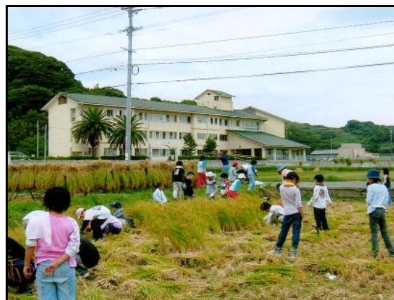
写真4 食農教育への取組

今後も給食やおやつを提供しながら、食農教育の講座や体験等の活動を継続的に計画している。