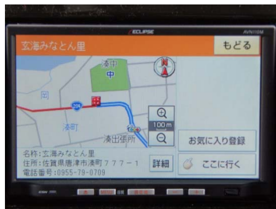
写真3 掲載されたカーナビ画面

以前は、カーナビ画面上に表示されておらず、福岡市からの観光客を呼び込むためには、カーナビに直売所を登録することが不可欠であると考えた。店長や役員が中心となって、粘り強くカーナビ会社と交渉した結果、今ではカーナビに登録され、確実に来店者は増加し、リピーターも増加している。