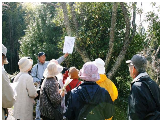
写真6 語り部の活動

このような取組の中で、天野地区の知識を高め、ふるさとの良さを再確認することで、天野地区を訪れる観光客に対してすべての会員が天野地区の良さを外部に情報発信するとともに、史跡巡りの語り部を育成し、語り部活動を充実・強化することでリピーターやサポーターの確保と地域の活性化に努めている。