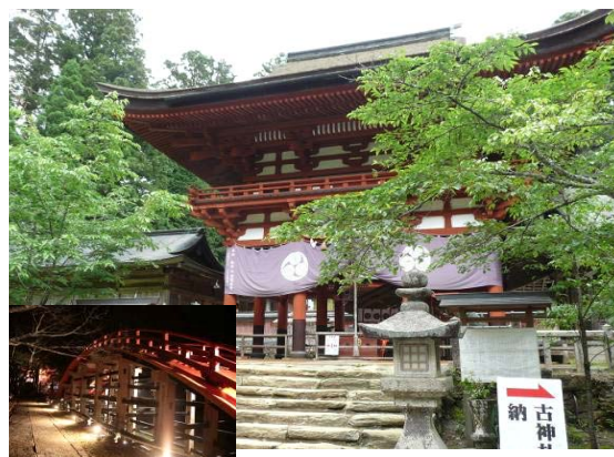
写真1 丹生都比売神社

天野地区の自治区全体での取組を考えたが、全住民の理解を得るには相当な時間を要するため実現には至らなかった。