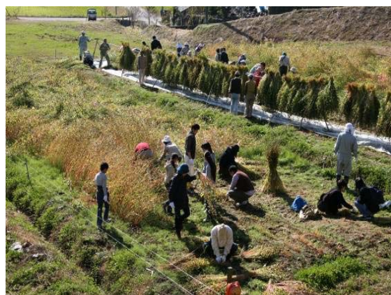
写真4 そばの刈り取り

そばを収穫する作業は重労働であり、栽培面積の拡大が困難であったが、(株)クボタが行う社会貢献活動「クボタeプロジェクト」により大型汎用コンバインを借りて、収穫することにより栽培面積の拡大を行っている。