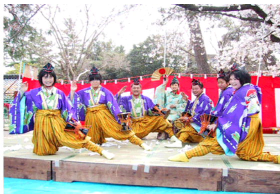
写真3 三河万歳保存会

安城市一般廃棄物処分場が平成11年にゴミの埋め立てが終了したことから、住民の交流場として、その跡地に農作物が栽培できるような良質な土壌にすることを目的として