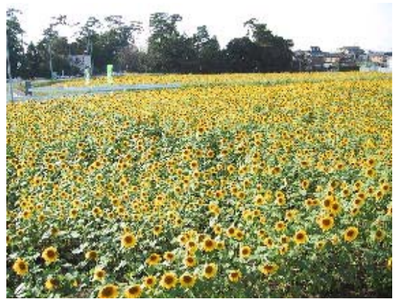
写真4 咲き誇るひまわり

こうした取組は、人と人、人と自然がふれあえる場を提供することにより地域活性化につながっている。