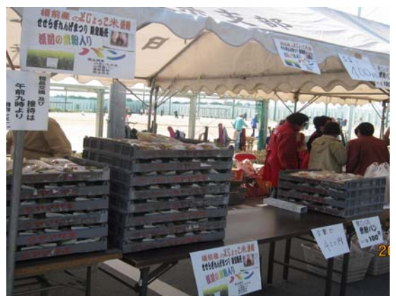
写真2 どじょっこ米粉パン販売