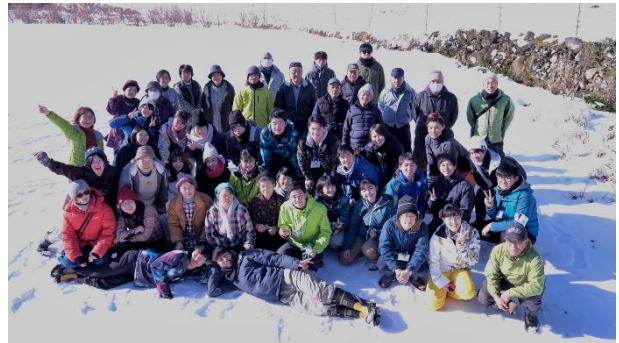
写真4 冬×ふじやまプロジェクト2020

真冬に富士山集落に人を呼ぶこととして、平成28年から毎年実施。集落で余っている竹を用いて竹灯籠を作成し、来訪者との交流に取り組む。