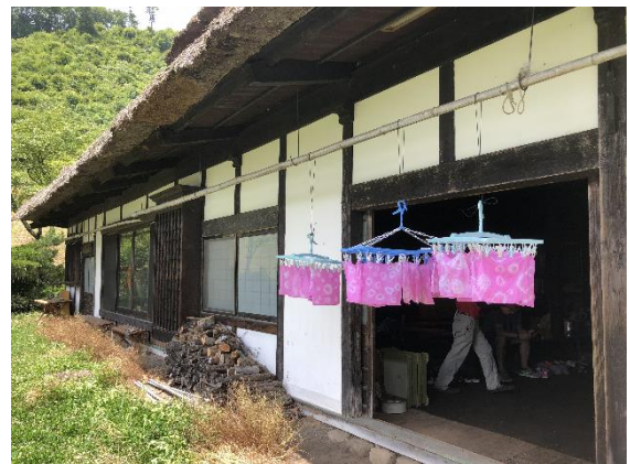
写真5 古民家での紅染め（乾燥）

集落の女性グループ「花の会」が紅花栽培・加工品開発販売・紅花染めの体験プログラムを行う他、都市との交流イベント等では郷土料理でのおもてなしをするなど協議会活動の一翼を担っている。