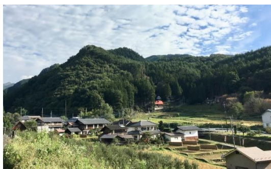
写真1 富士山集落遠景

先人達の知恵が結集した石垣の棚田を守りながら暮らしてきた富士山集落では、急速な少子高齢化と生活形態が変化するなかで、大型機械が導入できず生産性の悪い棚田で稲作を行う農家が近い将来いなくなり、棚田が荒廃し今の景観が失われてしまうとの大きな懸念が生じた。