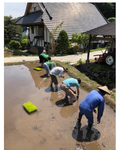
写真3 棚田オーナーによる田植え

平成30年から、千葉県千葉市のマンション管理組合と連携して棚田オーナー制度を試験的に開始し、現在まで18組の参加、延べ約200人以