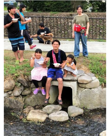
写真2 学生サポーターの参加