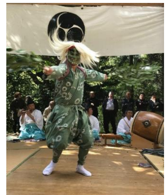
写真4 神楽奉納の様子