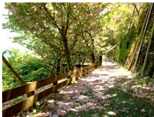
写真7 桜で敷き詰められた道

桜の季節には「天空の里 高野地 季楽の桜まつり」を開催し、市街地から集落までの道中に、集落への案内板を設置している。