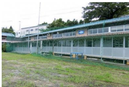
写真2 旧長谷小学校

この課題を解決するため、旧校舎をアルバイトの簡易宿泊所として整備することを利用協議会で決定した。宿泊所を整備するため、令和元年8月に高野地みかん組合とアルバイト受入れ農家で構成する「高野地雇用促進協議会」を結成、利用協議会が八幡浜市から借り受けた校舎を、雇用促進協議会が利用することとなった。