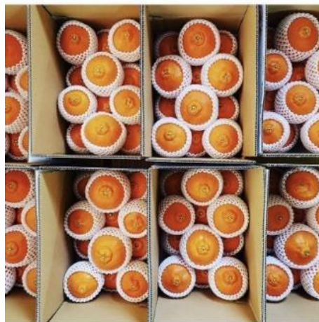
写真6 箱詰めされた返礼品

返礼品は、果物コースとマーマレードコースの2コースを用意した。果物コースは予定していた毎月50件の注文を受け、マーマレードコースは開始から約40件の注文を受けている。