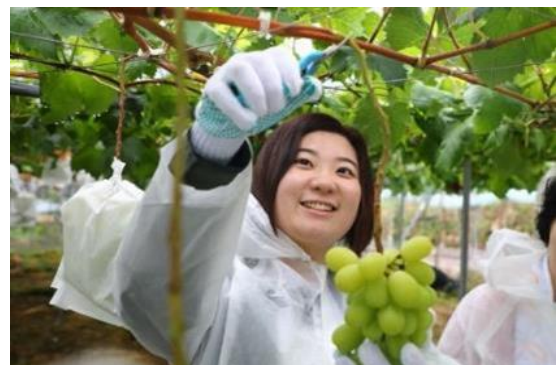
写真5 体験ツアー後に移住した地域おこし協力隊員

この結果、ツアー参加者のうち1名が高野地集落を気に入り、令和2年4月から地域おこし協力隊員として活動を開始した。新型コロナウイルス感染症に伴う学