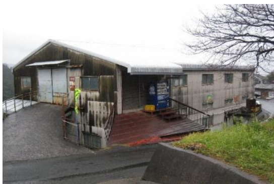
写真1 みかん生産の拠点となる集出荷

生産組合は、高品質安定生産を活動の軸に置き、温暖化する気象を考慮した品種構成や新品種の導入、老木からの改植、園地基盤整備、スプリンクラーの導入、後継者の育成など、集落の様々な課題に意欲的に取り組んでいる。長年の活動の結果、現在、後継者が11人育成されるなど、活動が実を結んでいる。