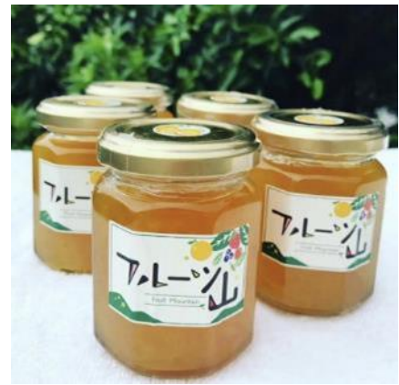
写真3 金賞を受賞した「河内晩柑マーマレード」

今後も、地域の多種多様な地域農産物を利用し、新商品開発や販売戦略等の強化に努め、集落の活性化や雇用確保の核となるよう活動を展開していく予定である。